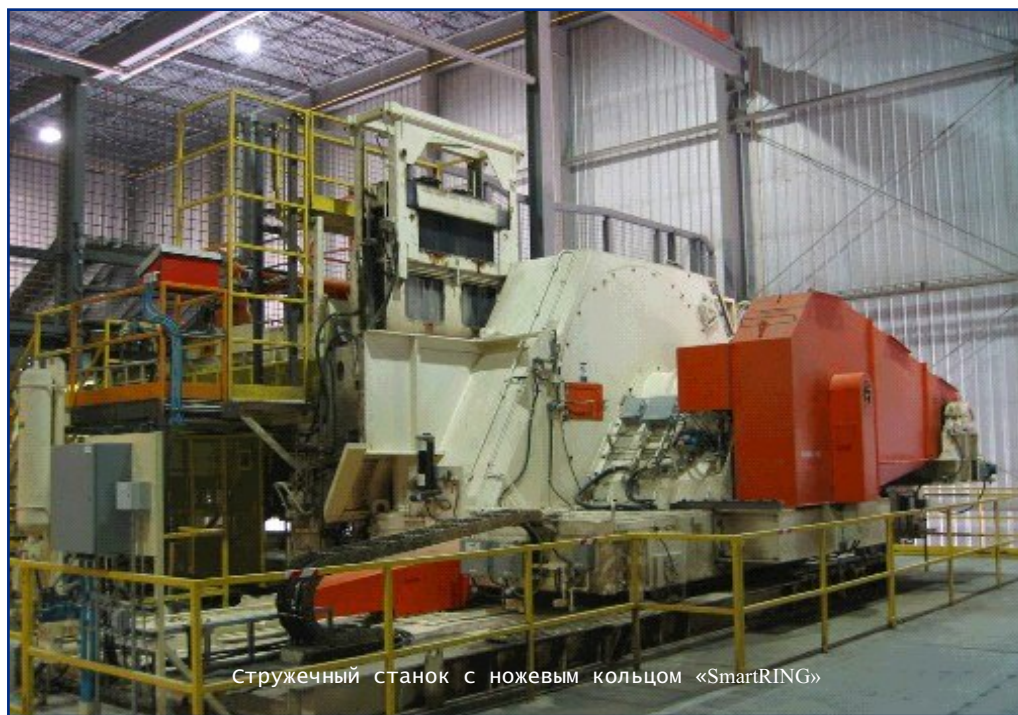
Стружечный станок с ножевым кольцом «SmartRING»