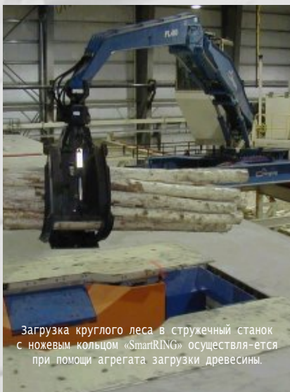
Загрузка круглого леса в стружечный станок с ножевым кольцом «SmartRING» осуществляется при помощи агрегата загрузки древесины.