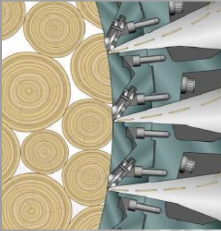
Процесс изготовления стружки

28/59 SmartRING стружечный станок Время цикла в секундах на стружку толщиной 0,65 мм